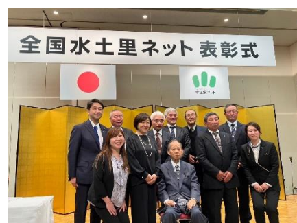
全国水土里ネット表彰式に出席