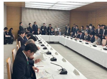
首相官邸で観光立国推進閣僚会議に出席