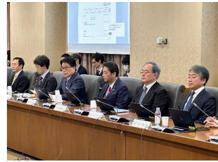
財政制度等審議会に出席