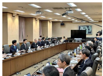
全国財務局長会議に出席