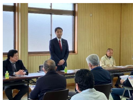
徳島市で土地改良及び森林組合関係者に国政報告・意見交換