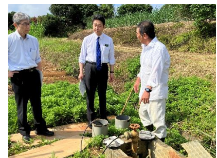
与論島で現地調査及び意見交換