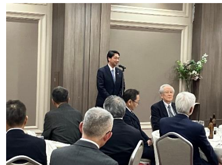
土地改良測量設計技術協会懇親会で挨拶