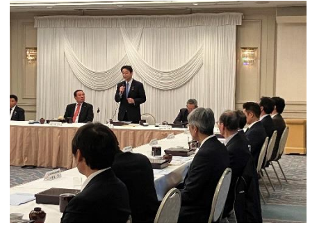
全国大規模農業水利協議会に出席