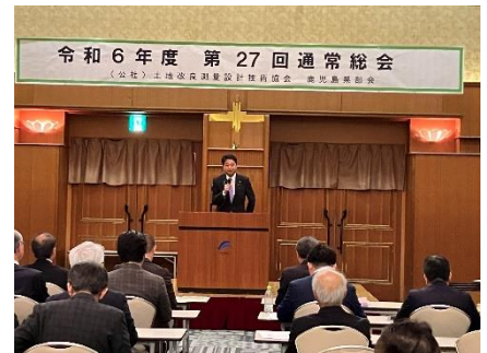
鹿児島県で土地改良測量設計技術協会 鹿児島県支部総会において講演