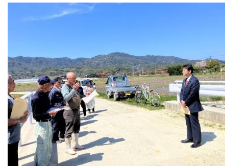
島根県松江市新庄町にて現地調査及び意見交換