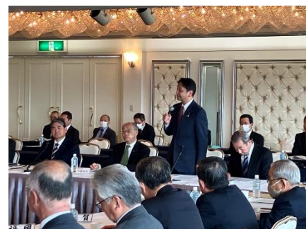
全国林業政治連盟総会に出席