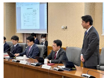
財政制度等審議会に出席