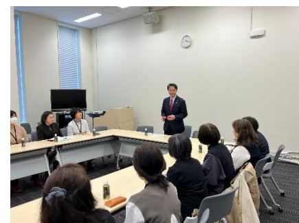
福岡県と広島県の女性農業委員の方々と意見交換